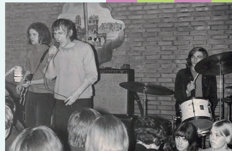
Cuby and the Blizzards in Zaal Boekema