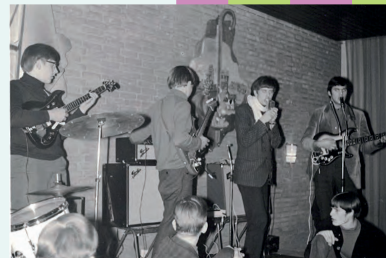
The Example in Zaal Boekema