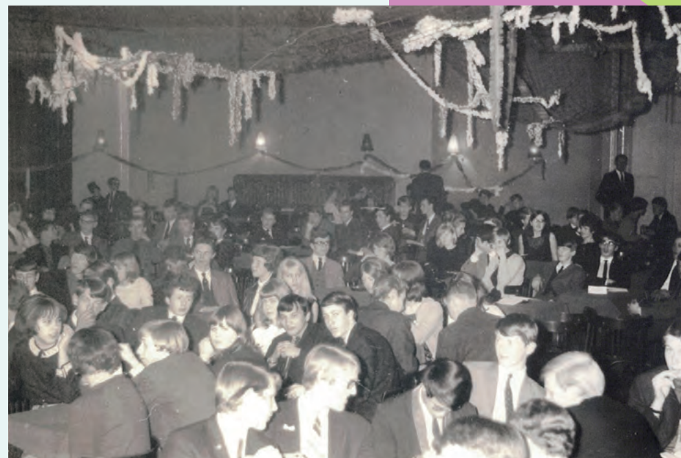
De drukke dansavonden in het VVH-gebouw.