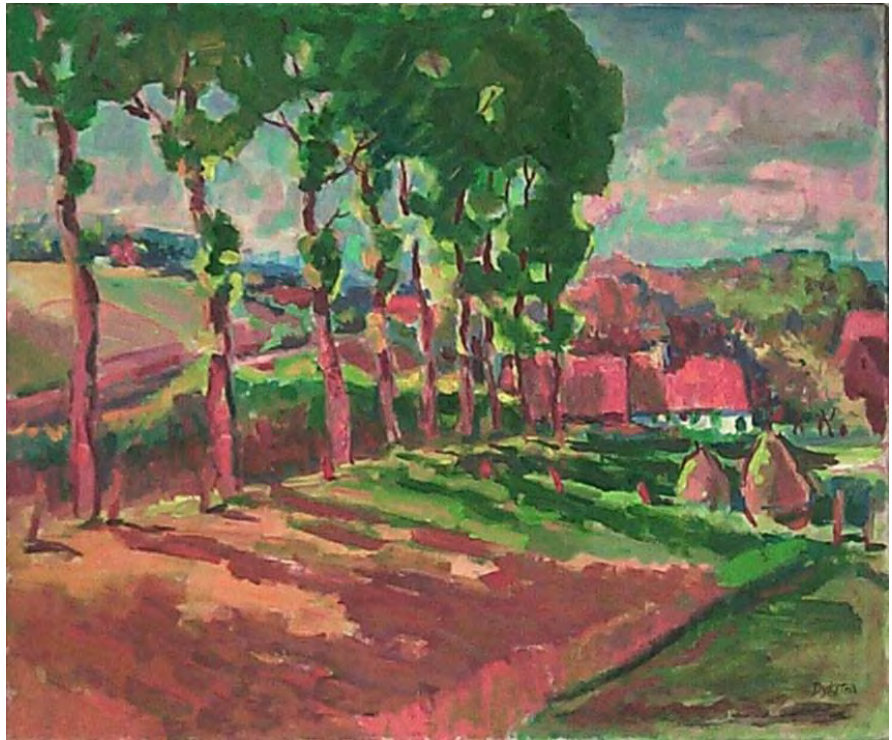
Schilderij 'Roggestompen' Gesigneerd rechtsonder: 'DYKSTRA' 50 x 60 cm

Zeven argumenten waarom het schilderij 'Roggestompen' een vervalsing is: