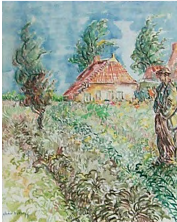
Aquarel 'Blauw Börgje,' Gesigneerd linksonder: 'Johan DYKSTRA' 34.2 x 28.1 cm

Zeven argumenten waarom het schilderij 'Blauw Börgje' een vervalsing is: